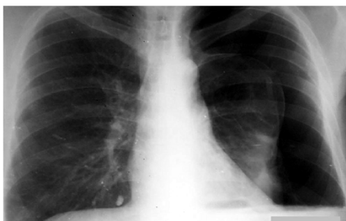
Обзорная рентгенограмма грудной клетки, прямая проекция.

В анализах крови: гемоглобин – 125 г/л, эритроциты – 3,6 \cdot 10^{12} , гематокрит – 35%.